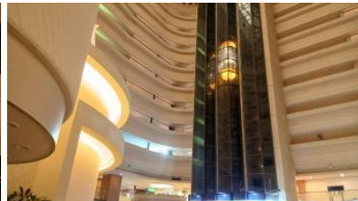
マリオットホテル