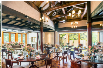
メゾン・ド・リアン 旧青葉延太郎邸 チャペル